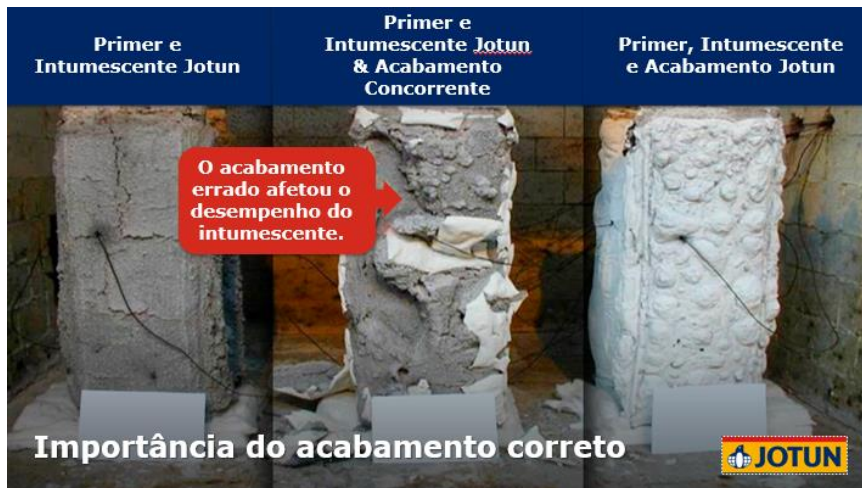
Figura 5 – Exemplo de revestimentos de acabamento exposto ao teste de fogo

Essa situação é ilustrada na Figura 5, na qual um acabamento não aprovado é aplicado sobre uma tinta intumescente causando seu deslocamento durante um teste de fogo.