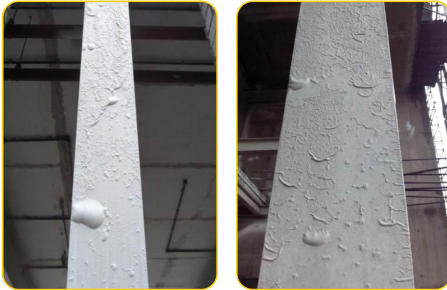
Figura 2 – Exemplo de revestimento acrílico exposto ao intemperismo