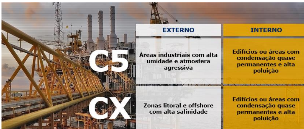
Figura 3 – Classificação dos ambientes conforme ISO 12944-2